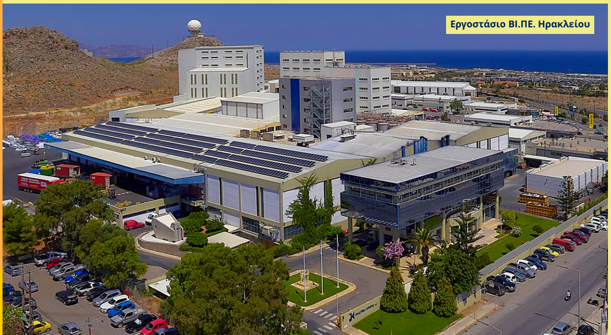
Εργοστάσιο ΒΙ.ΠΕ. Ηρακλείου